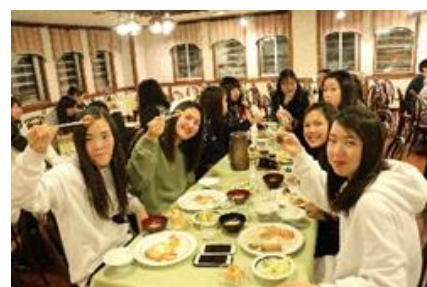
昨年のスキー・スノーボード研修風景