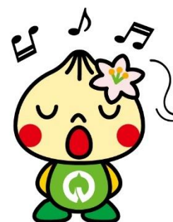
八百津町イメージキャラクター「やおっち」