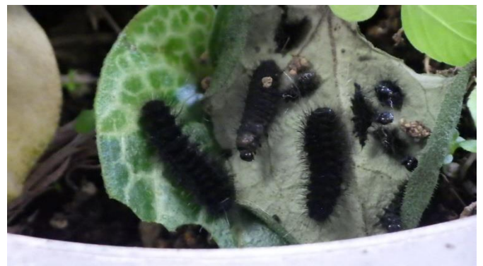
(ギフチョウの飼育・観察)