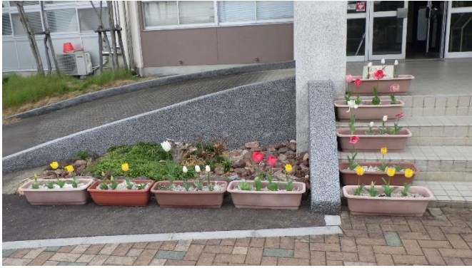
(チューリップ栽培)