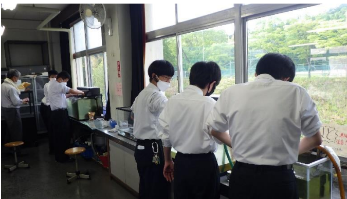
(熱帯魚と鯉の飼育)