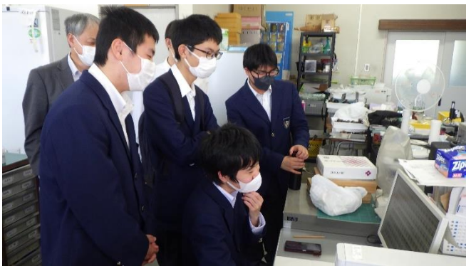
(裏山に生息する生き物のデータ処理)