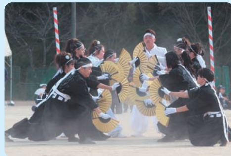
体育大会 (応援合戦白団)