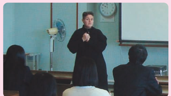
ハニトさん(イスラエル出身)による杉原千畝人権講演