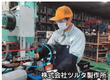
株式会社ツルタ製作所