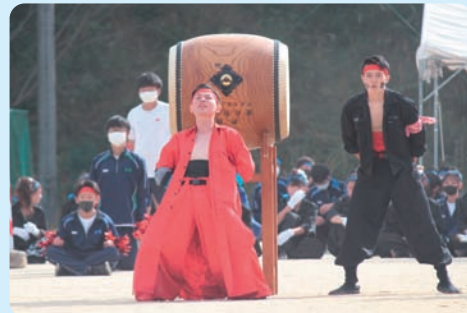
体育大会 (応援合戦赤団)