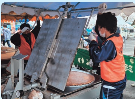
産業文化祭 ボランティア