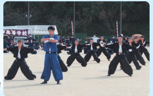
体育大会 (応援合戦青団)