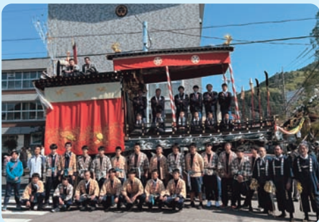
八百津祭り ボランティア