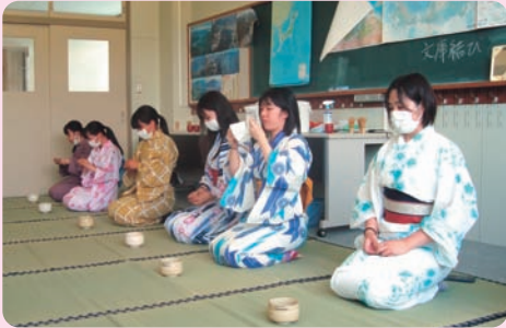
生活教養 (3年次選択授業)