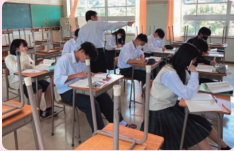
数学 I A (1年次習熟度別授業)