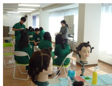
岐阜美容専門学校