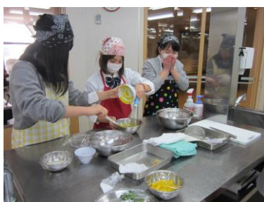
ベルフォートアカデミー