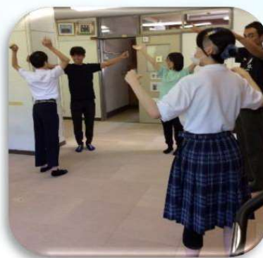
朝の活動(ラジオ体操)