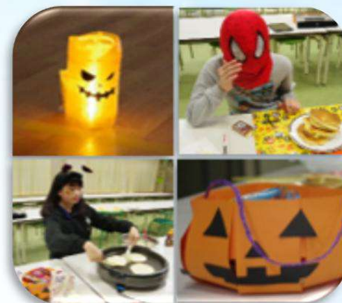
ハロウィンパーティー