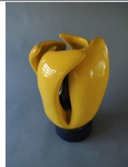
部員作品②_R1年度制作 3月