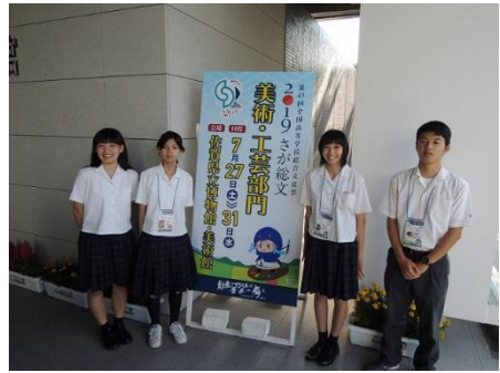
全国総文（佐賀）_R1佐賀県開催 8月