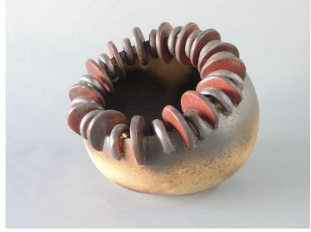
全国総文（佐賀）_R1出品作品① 8月