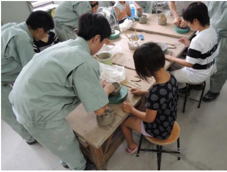
陶芸教室_R1多エオブソツカッス 7月