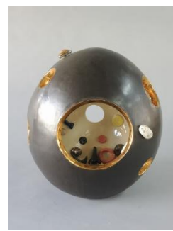
全国総文（佐賀）_R1出品作品② 8月