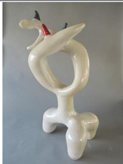
部員作品①_R1年度制作 3月