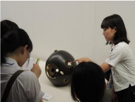
全国総文（佐賀）_R1作品交流 8月