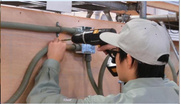
ものづくりコンテスト_電気工事部門12月