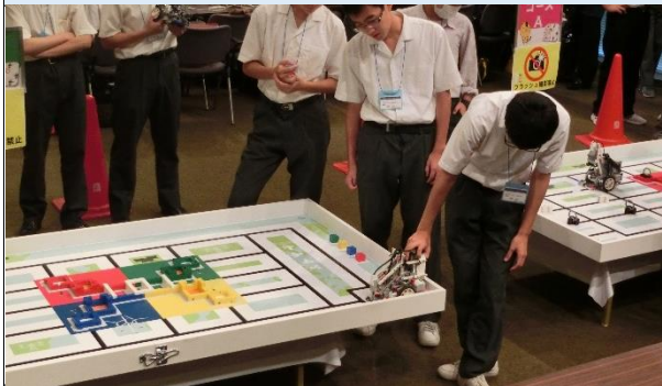
レゴロボット大会_大会の様子8月