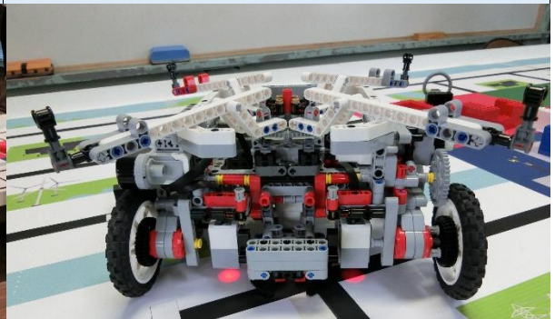
レゴロボット大会_レゴマシン 8月