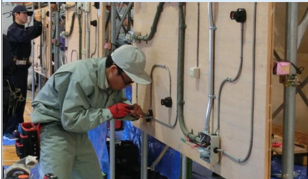
ものづくりコンテスト_電気工事部門12月