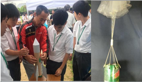
缶サット甲子園_🚀準備 7月