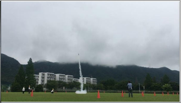
缶サット甲子園_🚀打ち上げ 7月