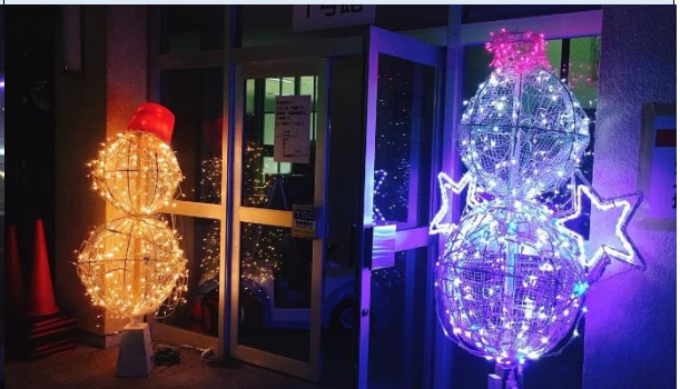
県病院イルミネーション 12月