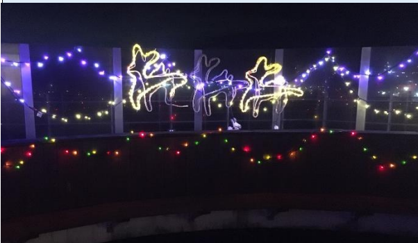
県病院イルミネーション 12月