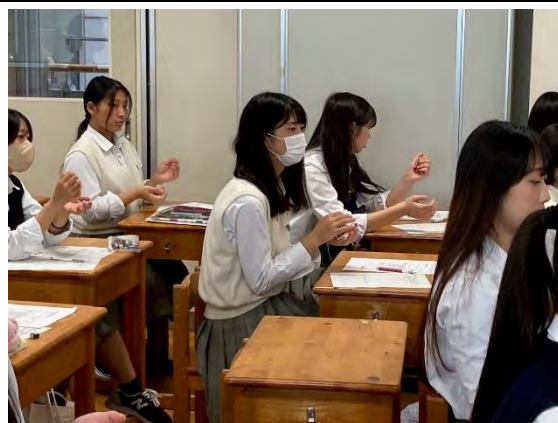
<児童文化財（お手玉）でのリズム遊び>