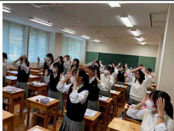
<手遊び・リズム体験①>