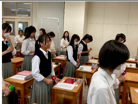
<ミュージックベル演奏>