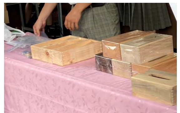
工業系生徒による作品展示も行いました。