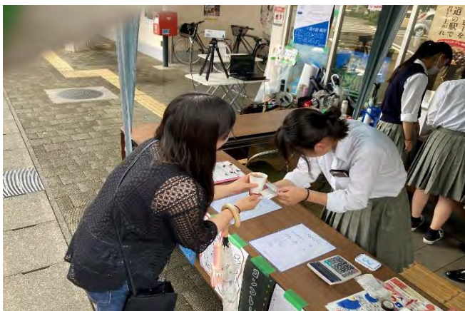
フランクフルトやアイスクリームの販売は 衛生面にも気を使い販売しました。