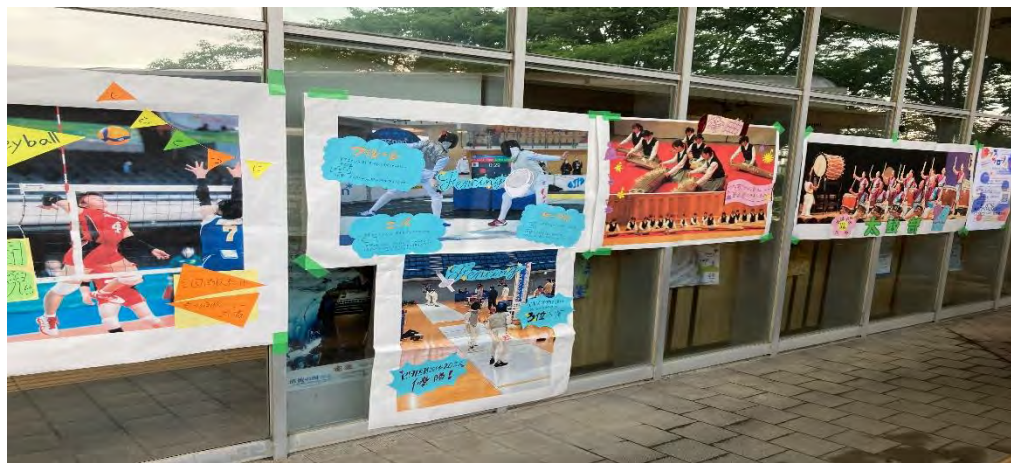
運動系の部活動の実績 紹介です