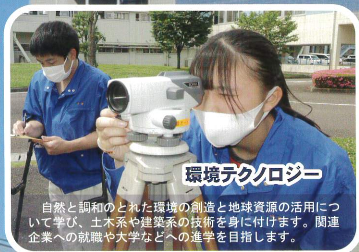
環境テクノロジー

機械加工技術などを学ぶことにより、機械や産業用ロボットに関する知識や技術を身に付けます。機械系の関連企業への就職や大学などへの進学を目指します。