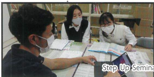
進学志望者の学力アップをサポートします。