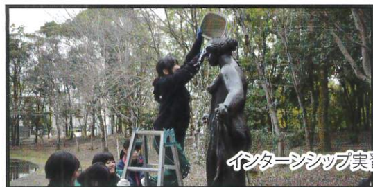
インターンシップ実習

岐阜総合学園高校1年次生の「産業社会と人間」の授業では、人生設計の方法を学びます。人は、年代や置かれた環境で人生設計を作り直したり、修正したりしながら生きていかなければなりません。そういった事態に直面した時、何をどう考えて人生設計をしていったらよいのか、実際にライフプランを作りながら、その方法を学びます。ライフプランで立てた「夢」の実現へ向けての第1歩として、2、3年次生から自分だけの時間割で学び努力していきます。