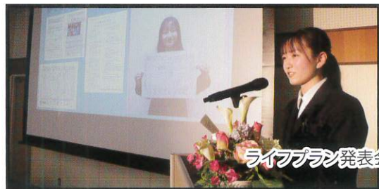
ライフプラン発表会