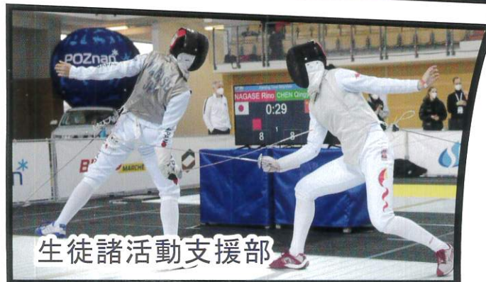
生徒諸活動支援部