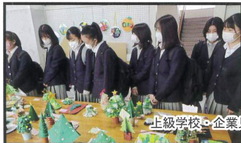
上級学校・企業見学