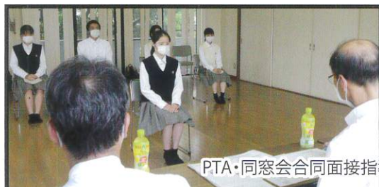
PTAや同窓会の先輩方から面接の指導を受けます。

幅広い進路に対応するために、充実したサポート体制で夢が実現できるように応援しています。