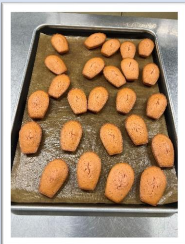
いちごマドレーヌ