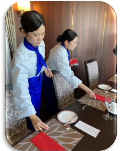
テーブルセッティング