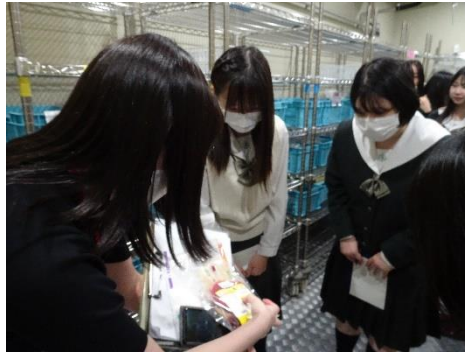
実際の赤血球製剤を見ました