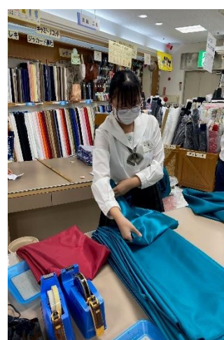
株式会社大塚屋岐阜店