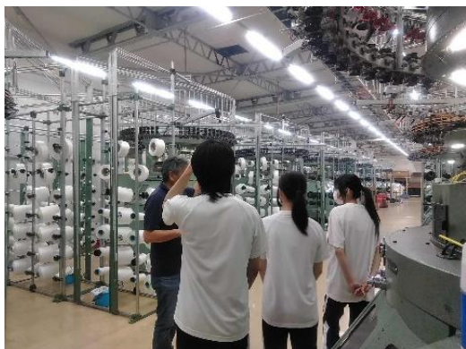
カワボウテキスチャード株式会社

イオンモール大垣・株式会社大塚屋岐阜店・カワボウテキスチャード株式会社・川村ニット株式会社・株式会社クインズゲイト・岐セン株式会社・三甲テキスタイル株式会社・ファインテキスタイル株式会社・ファッションセンターしまむら（安八店・岐阜経済大前店・真正店）・株式会社平和堂アルプラザ鶴見店・株式会社ボンフォーム・(株)ユニクロモレラ岐阜店 等