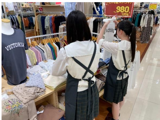
株式会社平和堂アルプラザ鶴見店