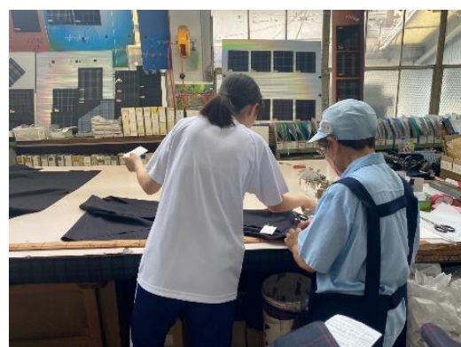
三甲テキスタイル株式会社