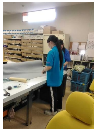
株式会社ボンフォーム