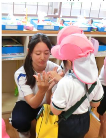
こばと第三幼稚園

(2) 体験的学習を通して、働くことの意義を理解するとともに、厳しさや楽しさを実感し、職業人になるための心構え、対人関係の大切さ、職業人としての基礎基本を学ぶ。