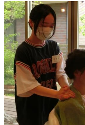
美容室 ジュンベリー