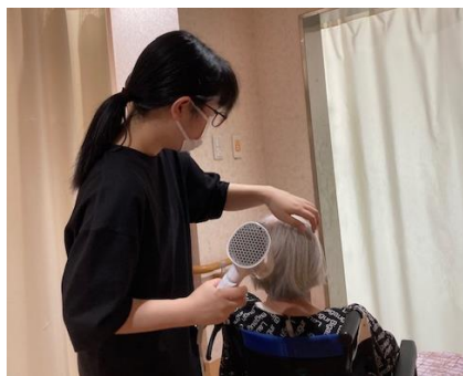
株式会社 羽島企画