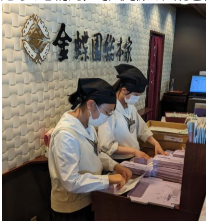
株式会社金蝶園総本家