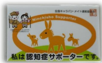
認知症クイズに挑戦

ランダムに出てきた単語を口に出して解答します。その後、出てきた単語を分類ごとに書き出しました！