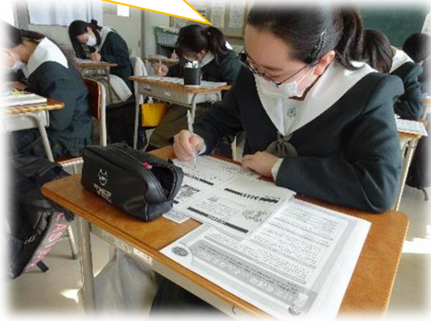
頭の体操(脳トレ)中

ランダムに出てきた単語を口に出して解答します。その後、出てきた単語を分類ごとに書き出しました！