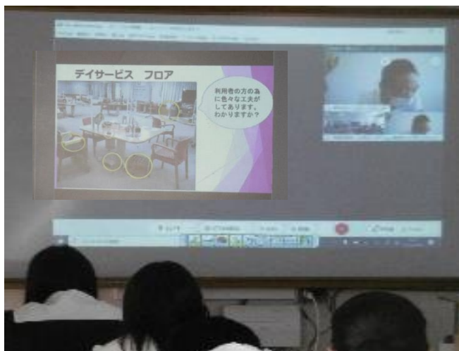
【パワーポイントでの講義】