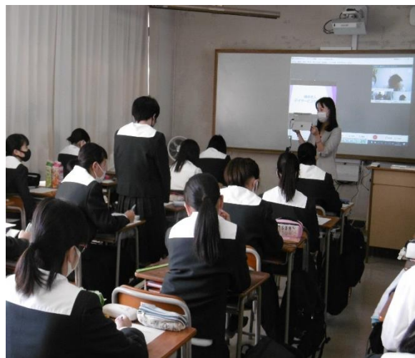
【講義内容についての交流・質問対応】