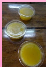
沖縄伝統菓子作り