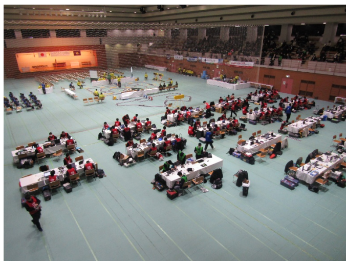
日本工学院専門学校 八王子校 体育館