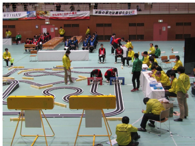
JMCR2019 大会コース約 63m