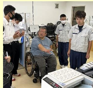
ナブテスコリンク