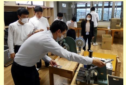
あいさんハウス岐阜