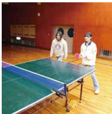
活動場所：多目的ホール