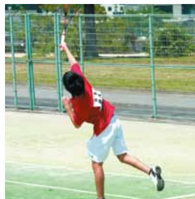
活動場所：テニスコート