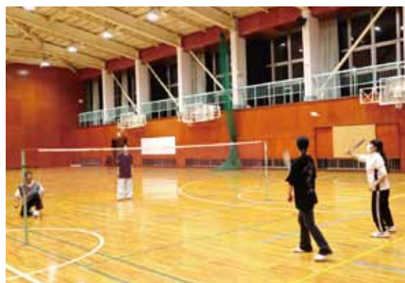
活動場所：体育館2Fアリーナ