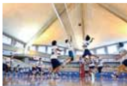
バレーボール大会