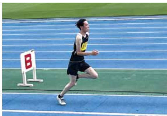
活動場所：グラウンド・体育館