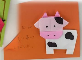
『子ども文化』 生徒作品