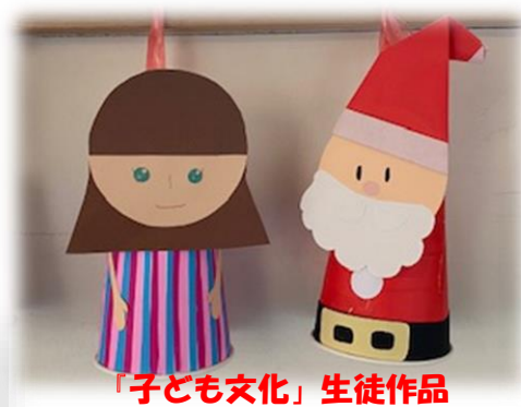
「子ども文化」生徒作品