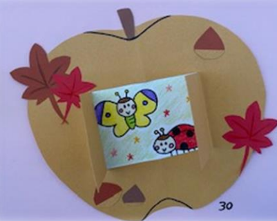
『子ども文化』生徒作品