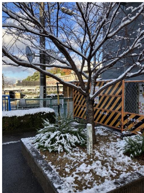
〈12/4 工事中校舎前の雪〉

※年末年始、急な連絡がありましたら学校公用携帯 080-2657-0340 へお願いします。