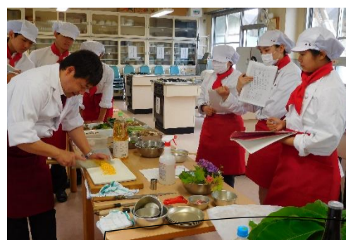
日本料理講習会:6月