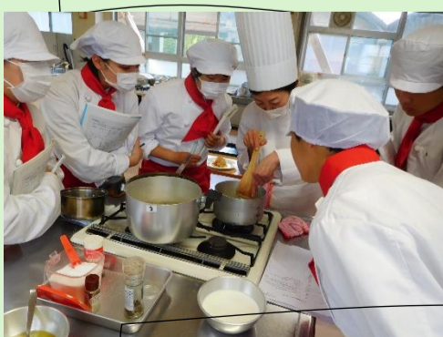
調理検定対策料理講習会:6月