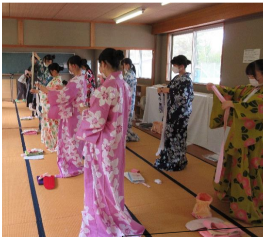
着付け講習会:6月(全2回)