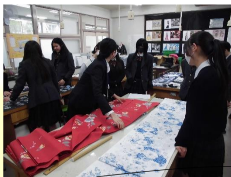
浴衣柄合わせ講習会:5月