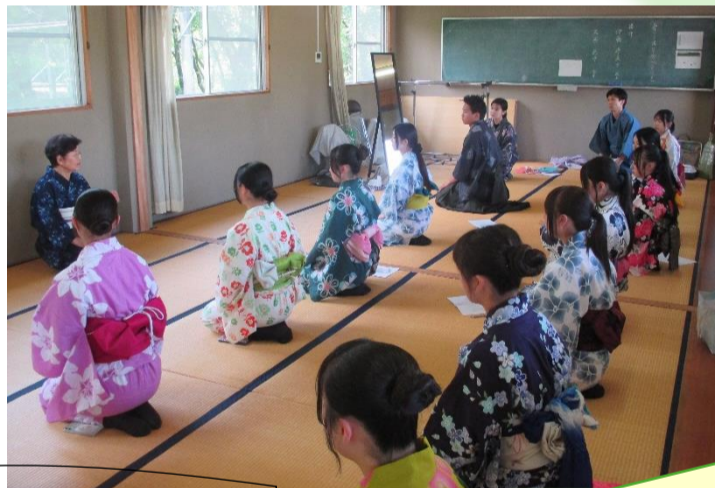
2年次に、自分たちで作った浴衣です!