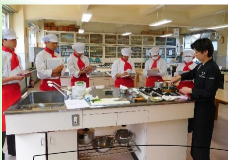
西洋料理講習会:5月