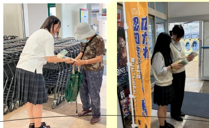
認知症支援街頭啓発ボランティア:9月