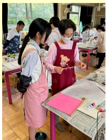
ツールペイント講習会:5, 6月