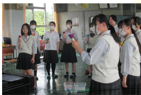
音楽療法講習会:9月