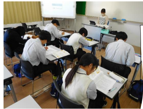
高大連携事業 食生活アドバイザー試験 対策講座:5月 @中京学院大学