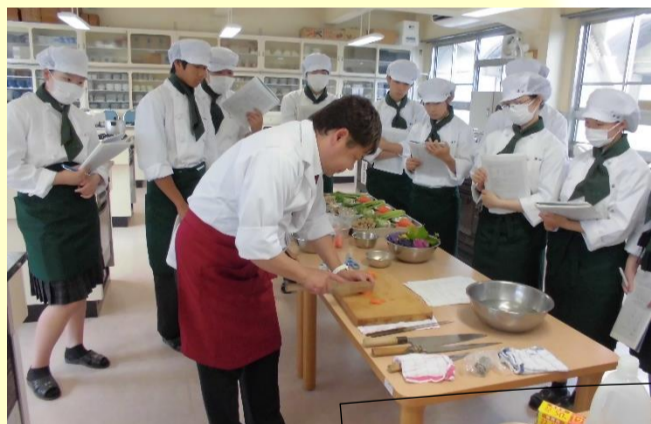
日本料理講習会:6月