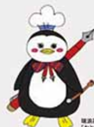
瑞浪高校公式キャラクター「おとめちゃん」