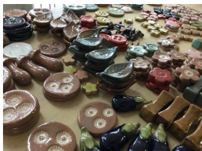
作業製品（はしおき）