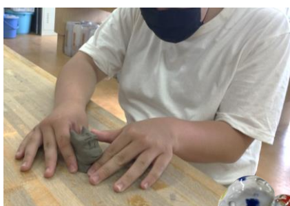
干支の置物作り（成形）