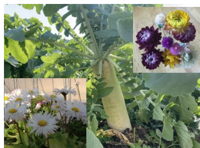
作業製品（野菜・花苗等）

ハウスと畑で、野菜や花苗を育てています。販売以外に野菜は給食センターに納品もします。