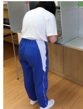
生徒会選挙 ～主権者教育～