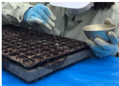
播種（ポット苗の種まき）