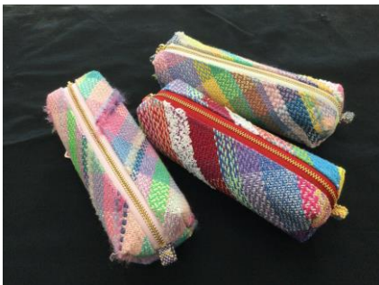
作業製品 (ペンケース)