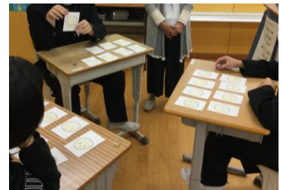
気持ちを伝えよう