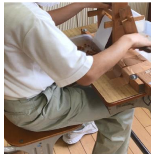
綿くり (綿と種を分離)