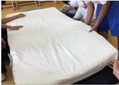
シーツの敷き方 ～宿泊学習に向けて～