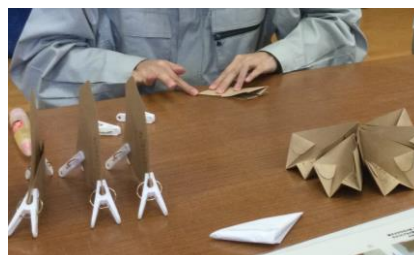
検尿カップの組立