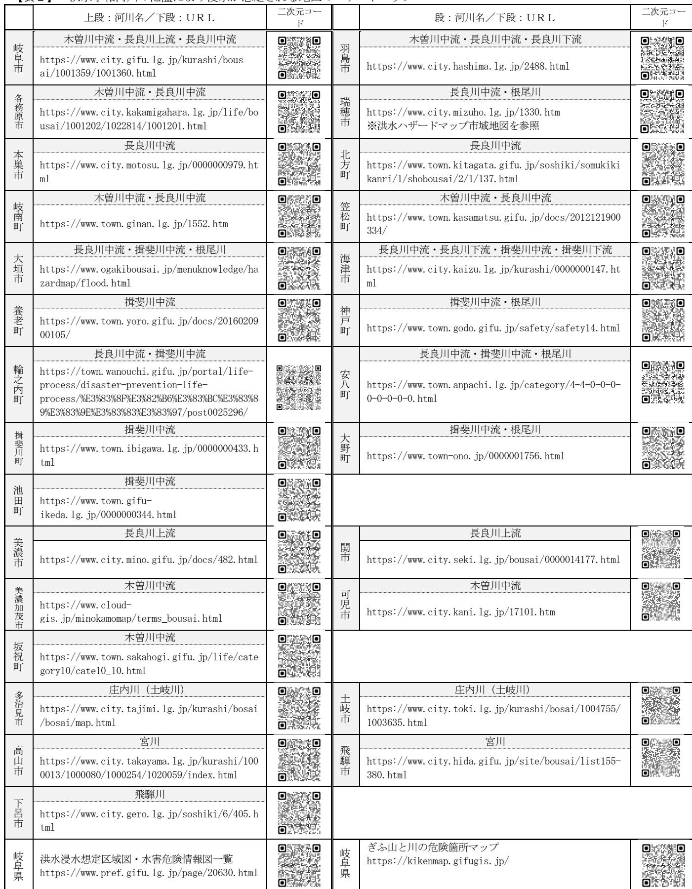
【表2】 洪水予報河川の氾濫により浸水が想定される地区のハザードマップ

※その他の河川及び上記に記載のない市町の洪水浸水想定区域については、各市町のHP等を参照のこと。