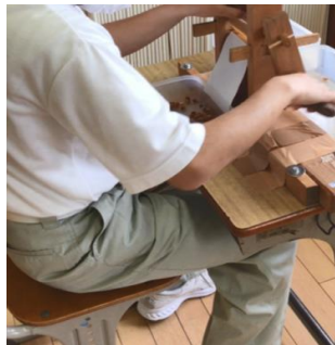
綿くり (綿と種を分離)