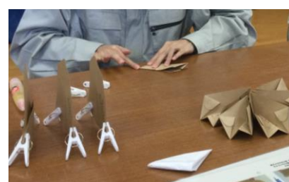
検尿カップの組立