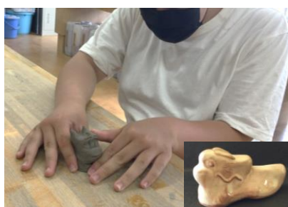
干支の置物作り（成形）