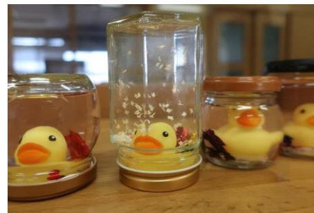
海津明誠高校で一緒に作ったスノードーム