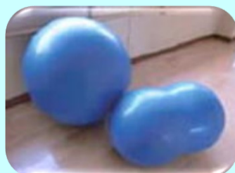
バランスボール ピーナッツボール