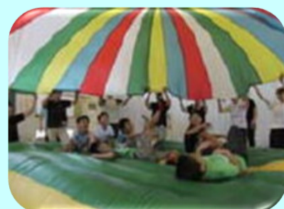
エアートランポリン & パラシュート