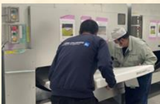
⑤マットレス機械洗浄