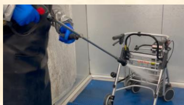
①車椅子歩行器の洗浄作業