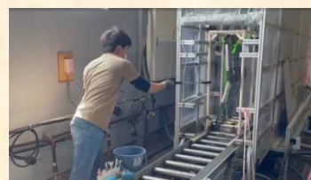
③電動ベッド機械洗浄