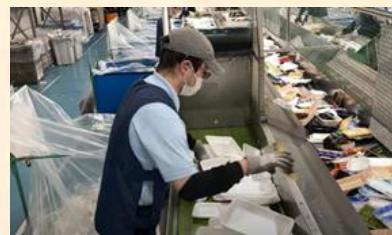
食品トレーの選別