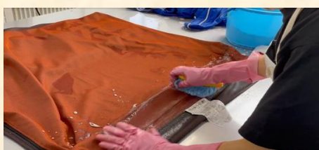
④マットレスカバー洗浄・洗濯作業