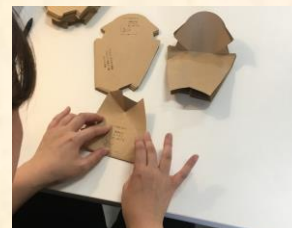
⑨検査キットの組み立て セット組作業