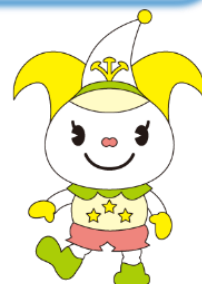
揖斐特別支援学校 オリジナルキャラクター いびりちゃん