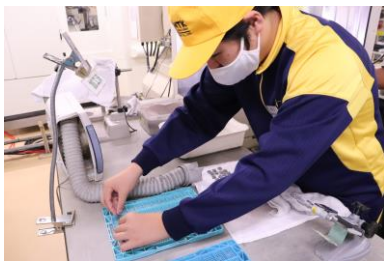
現場実習・校内作業実習