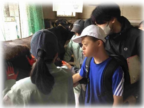
～動物のエサやり・ふれあい～