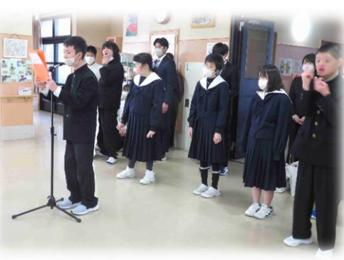
2年生 ～地域の方々と交流 (シニアホーム訪問)～