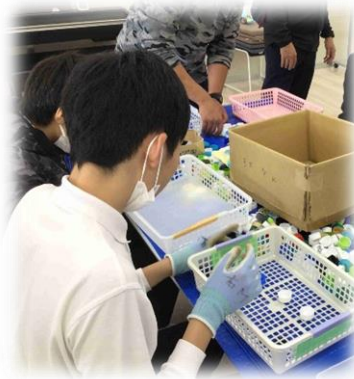
3年生 ～仕事を知ろう(職場見学)～