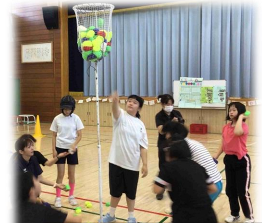
～ダンシング玉入れ～