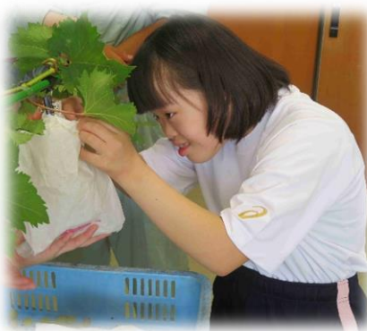
～ぶどうの収穫体験～