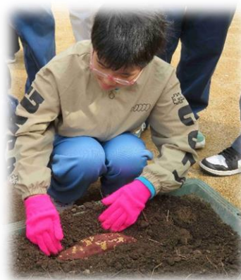
～サツマイモの収穫体験～