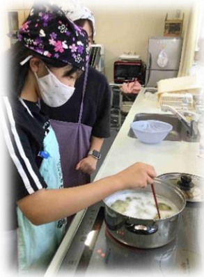
1年生 ～食生活を考える～