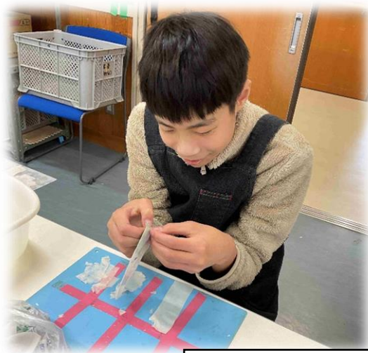
～ラミネートはがし～