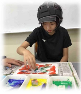
～美術(スタンプをしよう)～