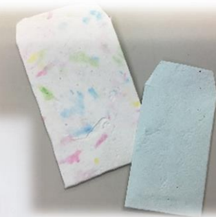
～新聞エコバック・ぼち袋～