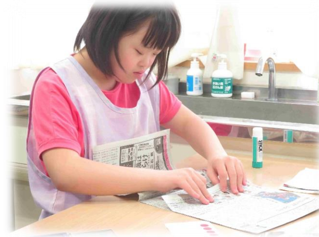
～新聞エコバックづくり～