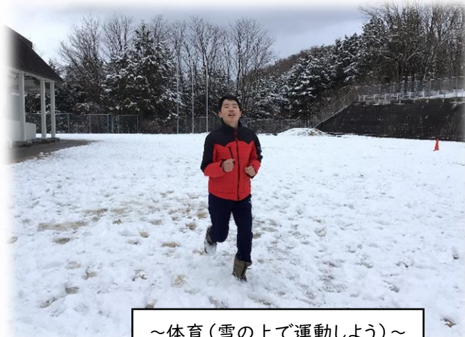
～体育(雪の上で運動しよう)～