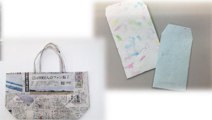
～新聞エコバック・ぼち袋～