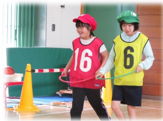
～二人でサーキット運動に挑戦～