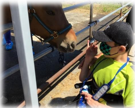
～動物のエサやり・ふれあい～