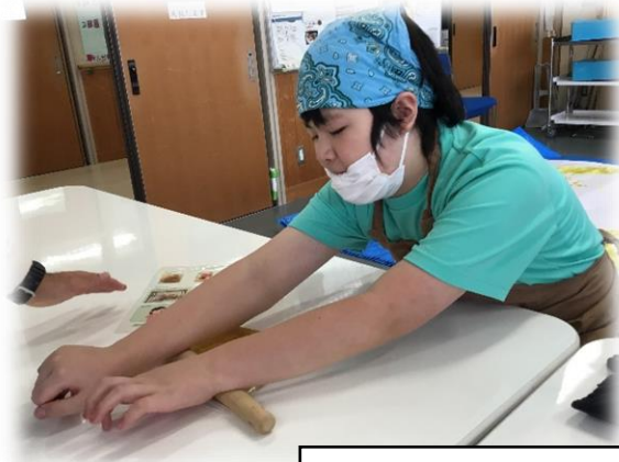
～育てた野菜を使った調理実習～