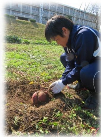
～サツマイモの収穫体験～