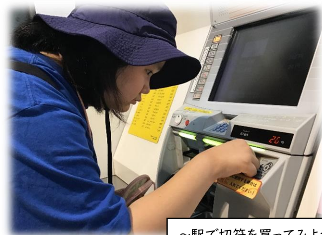
～駅で切符を買ってみよう～