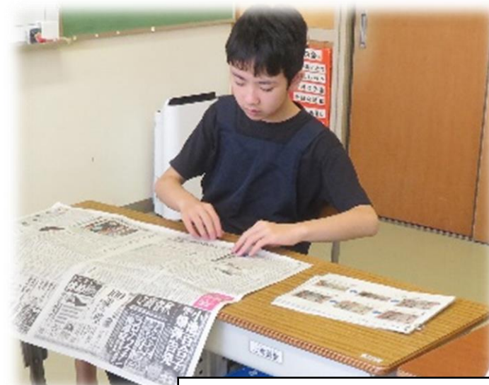
～新聞エコバックづくり～