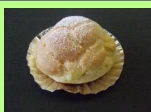
シュークリーム (小) 407