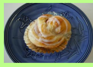
シナモンロール(小) 432