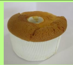
シフォンケーキ (12cm) 443