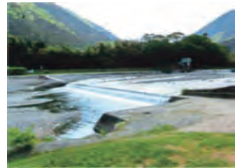
堰堤: 揖斐川町・粕川 かすかわ