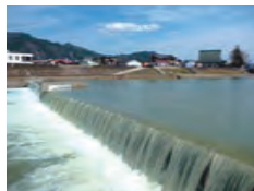
取水堰: 飛騨市・宮川 大古堰 みやがわのおおこせき