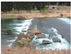
床止工: 高山市・荒城川 あらかがわ