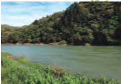
なからがわ いけしりちく 関市・長良川 池尻地区

一見おだやかに見える流れも、川ぞこの影響で流水は一定ではないんだよ。川の事故の約90%はこのおだやかな流れで発生しているよ。近寄る際はライフジャケットを必ず着用しよう！