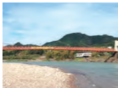
橋: 美濃市・長良川 美濃橋 なからがわ のはし