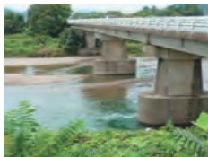
橋: 岐阜市、関市・武儀川 千足橋 むきがせんのはし