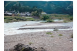
美濃市・板取川 いたどりがわ