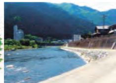
下呂市・飛騨川 ひだがわ

上流にダムのある川では、放流による増水に注意してね。事前に放流情報を確認し、川岸で遊んでいるときは常に放流予告のサイレンに耳を傾けよう。また、急に増水するところではぜったいに子どもだけで遊ばないで！