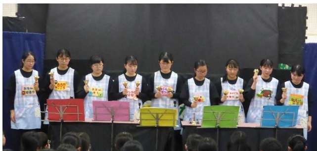
【ハンドベルの演奏】