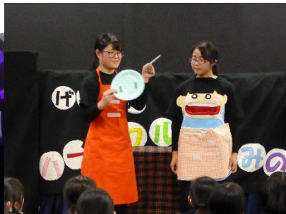
【エプロンシアター】