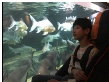
大きな魚がいっぱい迫ってきてびっくり！

12月3日（金）に、6年生14人は、バスに乗って、アクアトぎふや岐阜市科学館へ修学旅行に行ってきました。アクアトぎふでは、事前学習で学んだアユなどの魚を見つけたりピラルクの大きさにびっくりしたりしました。岐阜市科学館では、科学の力を使った不思議なゲームやおもちゃで何度も楽しみました。ぶるうすかいの昼食と、ホテルパークの夕食では、たくさんのおいしい料理をお腹いっぱい堪能しました。グループに分かれて、仲間とお互いに声を掛け合ったり、一緒に楽しんだりする姿がたくさん見られました。