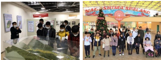
3年生の修学旅行の様子

新型コロナ感染が一時的に落ち着きを見せた11月から12月にかけて、校外で活動する機会を得ることができました。まず3年生は修学旅行で岐阜県さぼう遊学館やナガシマスパーランドへ出かけました。事前に土砂災害について学習したり、効率的なアミューズメントのまわり方を計画したりして、とても有意義な修学旅行となりました。2年生は岐阜市内の施設や公共交通機関を利用して自分の生活圏を、また1年生は岐阜市科学館でプラネタリウム、7・8組は県図書館で読み聞かせなど、それぞれ経験を広げるきっかけづくりができました。新年に入ってから書き初めや各学年のまとめに向けた取り組みを進めています。