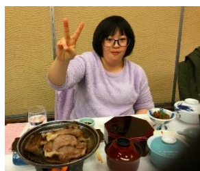
「飛騨牛づくし懐石」 柔らかく、口の中で とろける肉が「美味しかった！」