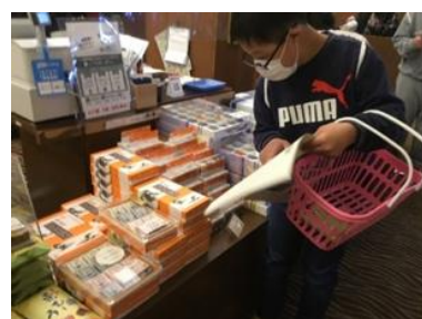
家族のみんなにお土産を買うよ。何にしようかな？