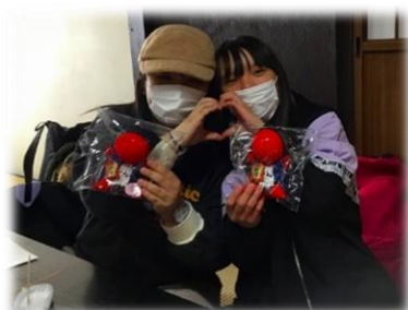
世界に一つだけの 手作りさるぼぼ

日帰りの修学旅行となりましたが、それでも「楽しかった！」や「もう一度行ってみたい！」という感想が多かったので、かけがえのない思い出の一つになったと思います。