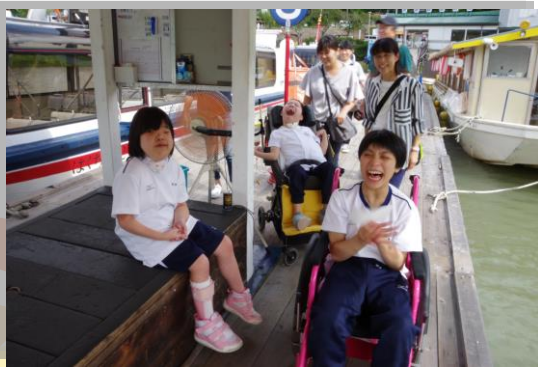
遊覧船に乗ったよ

2 日目は恵那銀の森で栗きんとん作りを体験し、ショッピングや散策を楽しむことができました。天気にも恵まれ、初めての経験もでき、すてきな思い出がひとつ増えました。