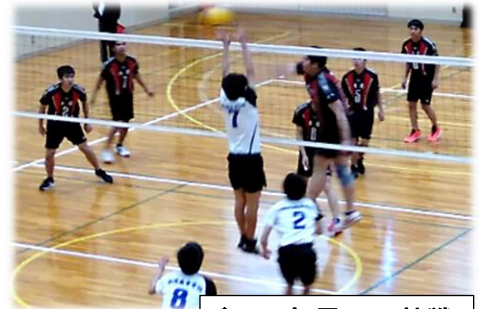
バレー部男子の熱戦

選手たちは「敗戦の悔しさ」を味わうとともに、「勝つために必要な何か」をつかみ取ってくれたことと思います。今後が楽しみです。