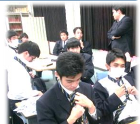
ネクタイの結び方練習

男女とも、「いよいよ大人の仲間入りする」ということを実感し、4月からの新しい生活を心に描きつつ、「おしゃれ」ではない「社会人(大人)としての身だしなみ」について真剣に耳を傾けているようでした。