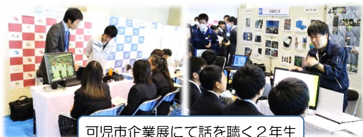
可児市企業展にて話を聴く2年生

大学・短大・専門学校や企業の方々から直接お話を聞きました、また、1年生は11月18日に進路見学会が行われ、希望に基づいた4つのコースに別れ、バスで県内や名古屋の大学や専門学校を訪れて、説明会や施設見学・体験等に参加しました。どちらの学年も生徒たちも、熱心に話を聞いてしっかりとメモを取ったり、体験に積極的に取り組んで何かを学び取ろうとしたり、せっかくのチャンスを生かそうとしていました。そして「いろいろ知らなかったことがわかった」「やる気が出た」「聞いた話を生かして進路先を決めたい」といった声も聞かれました。生徒たちはいろいろな刺激を受け、夢の実現にまた一歩近づいたことでしょう。