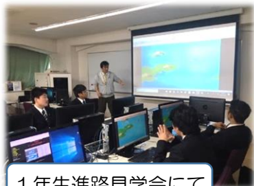
1年生進路見学会にて

3年生が続々と卒業後の進路を決定している中、1・2年生についても今後の進路決定に向けての行事が開催されました。2年生は11月12日、進学希望者は進学相談会に、就職希望者は可児市企業展に参加し、