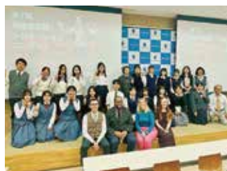
岐阜聖徳学園大学主催 英語レシテーションコンテスト優勝