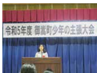
御嵩町少年の主張大会 特別賞