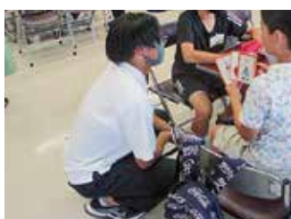
御嵩町小学生英語サマー ワークショップボランティア