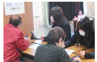
地域探究類型を選択したFさんの例