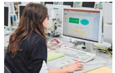
ビジネス類型を選択したGさんの例