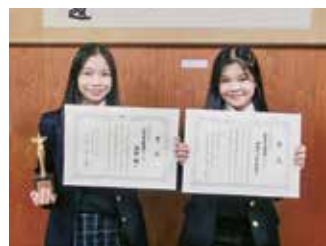
岐阜県英語スピーチコンテスト 最優秀賞・英語部会賞