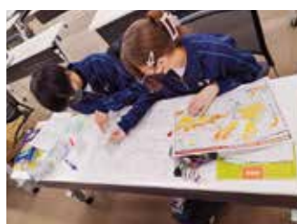
防災リーダー養成講座