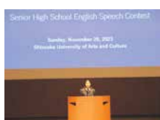
全国高校英語スピーチコンテスト 東海北陸ブロック大会 第3位