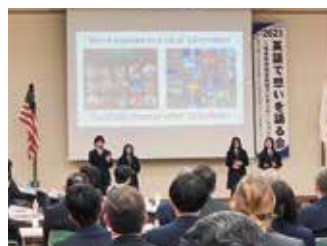
岐阜県高校生英語 プレゼンテーション大会 優秀賞