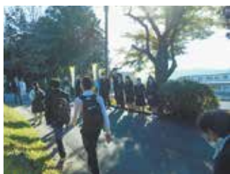
PTA・生徒会挨拶運動