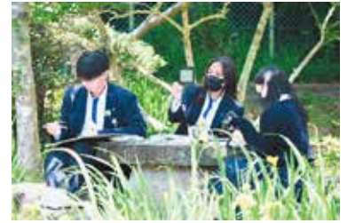
人文社会類型を選択したAさんの例