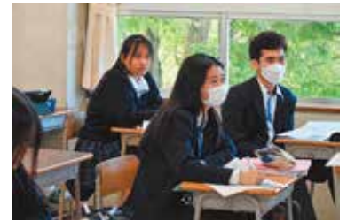
日本文化類型を選択したCさんの例