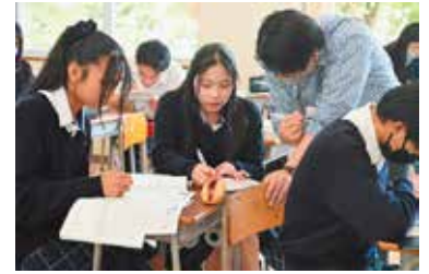
理数探究類型を選択したEさんの例