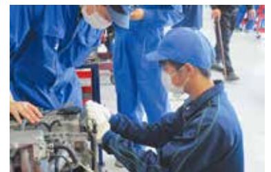
ものづくり類型を選択したHさんの例