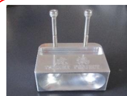
スマートフォンスピーカースタンド