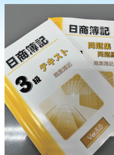
SAH 日商簿記検定の学習プロジェクト