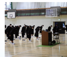
マナー講座 社会人としてのスキルを習得