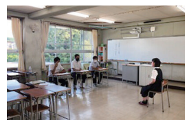
9月 法人会面接指導