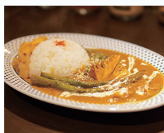
地元飲食店とのコラボ カレー店とのタイアップ