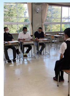
法人会面接指導 外部の方による就職試験前の面接指導