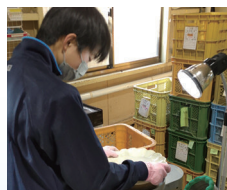
WEP 企業への3日間インターンシップ