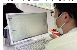
11月 秋の一日体験入学