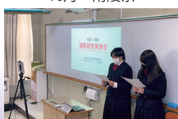
1月 課題研究発表会