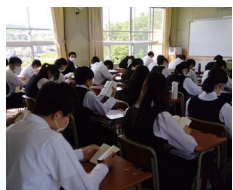
朝読書 読書習慣を身に付けてレベルアップ