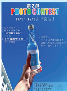
サイダープロジェクト ご当地サイダーの開発