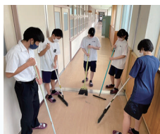
猛暑対策 涼しい格好で体調管理