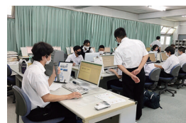
8月 中学生一日体験入学