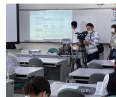
日商簿記1級 会計士、税理士の登竜門