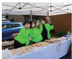
土岐商SHOP 校外での販売実習