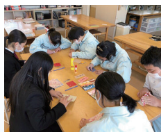
特別支援学校連携 多様性の理解を深める