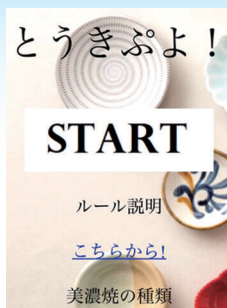
アプリ開発 地場産業の美濃焼きを使ったゲーム