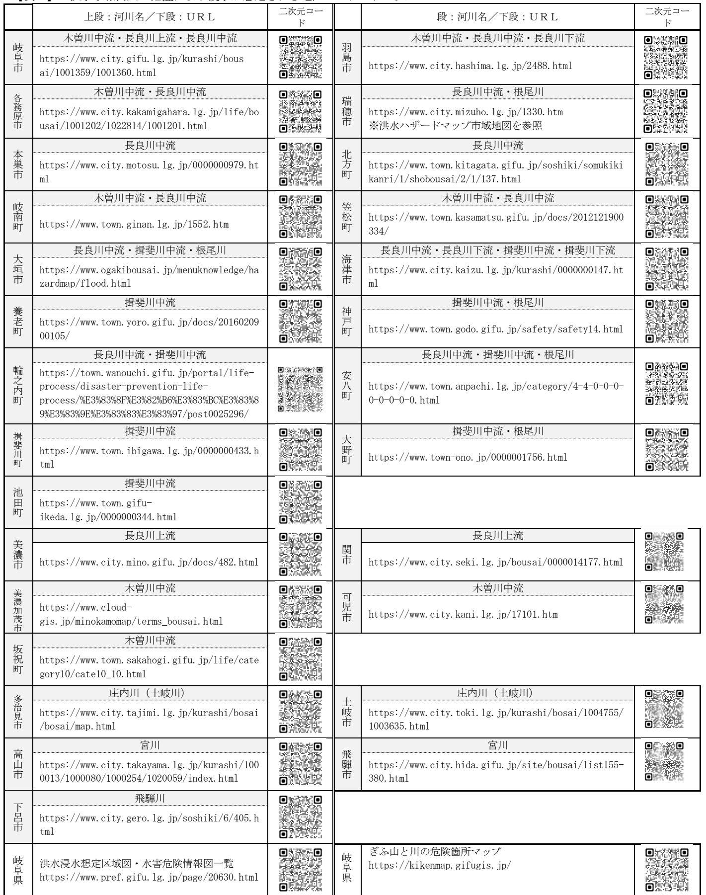
【表2】 洪水予報河川の氾濫により浸水が想定される地区のハザードマップ

※その他の河川及び上記に記載のない市町村の洪水浸水想定区域については、各市町村のHP等を参照のこと。