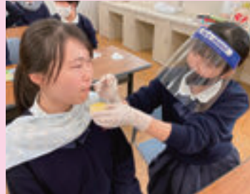
▲ 福祉看護（食事介助）