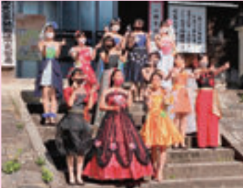
▲ 衣文化（地域でのファッションショー）