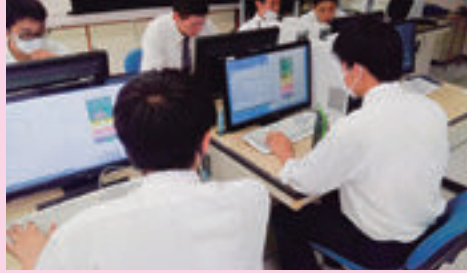
▲ プログラミング（作品の制作）