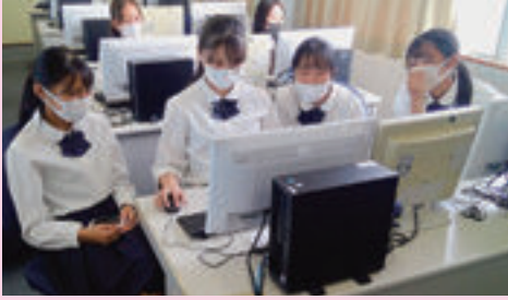
▲ 事務管理（社会人メイクの研究）