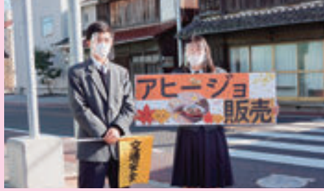
▲ 起業創造（コラボ商品のドライブスルー販売）