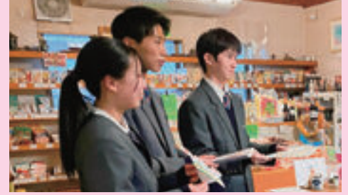
▲ 簿記会計（アンケートの依頼）