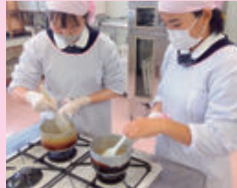
▲ 食文化（みそマロランタンの試作）