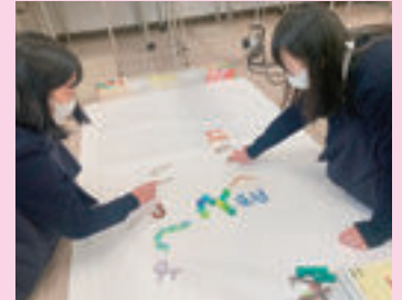
▲ 保育（オープニング用コマ撮り作成）