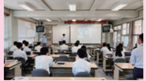
▲ システム開発（外部講師による授業）