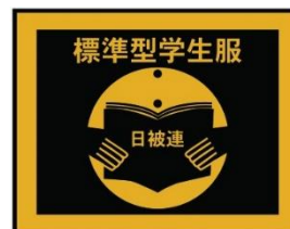
〈標準型学生服認証マーク〉